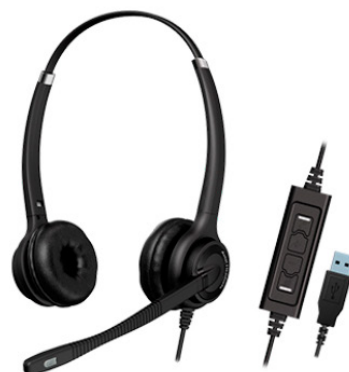
Суперприз для онлайн учасників секції КЦ Провідна гарнітура Elite MS HDvoice duo USB

*У розіграші призів приймають участь всі учасники секції КЦ, що заповнили реєстраційну анкету або пройшли онлайн опитування