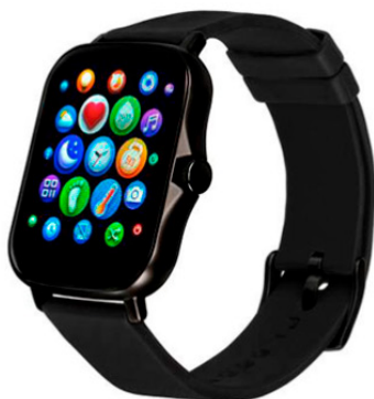
Суперприз від організатора Форуму офлайн учасникам Розумний годинник Gelius Pro GP-SW003