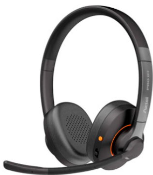
Суперприз від організаторів офлайн учасникам секції КЦ Безпроводна гарнітура Axtel Pro Bt duo