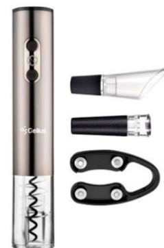
Суперприз для онлайн учасників Форуму Штопор для вина Gelius Wine Opener GP-GW-034

*У розіграші призів приймають участь всі учасники Форуму, що заповнили реєстраційну анкету або пройшли онлайн опитування