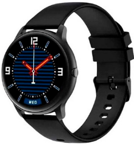
IMILAB Smart Watch KW66