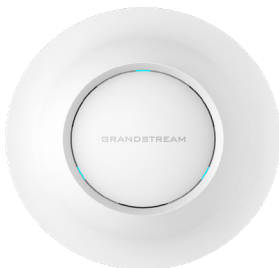
Точка доступа Wi-Fi Grandstream GWN7600 802.11ac Wave-2

*В розыгрыше призов принимают участие все участники Форума, заполнившие регистрационную анкету. Организатор оставляет за собой право заменить приз для розыгрыша