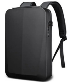
Рюкзак BANGE BG-22201 EVA